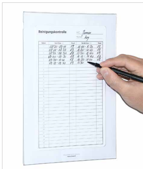
Wandmappe mit Schreiböffnung, ideal für die Reinigungskontrolle.