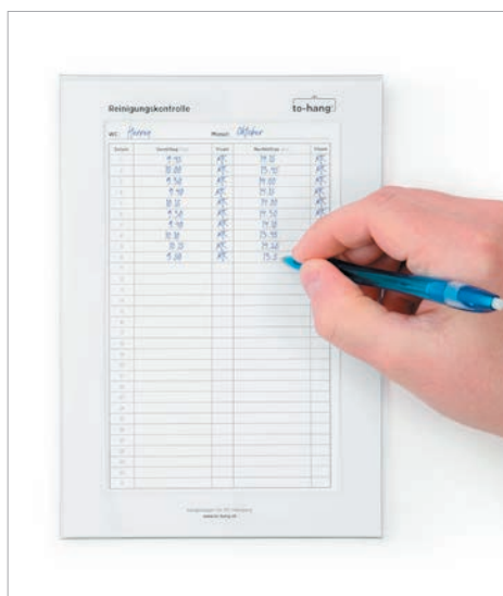
Wandmappe mit Schreiböffnung, ideal für die Reinigungskontrolle.