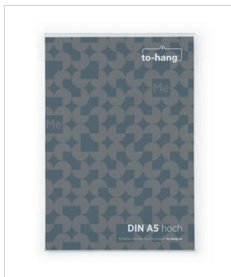
Wandmappe im Hoch- oder Querformat.